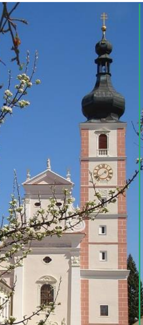
Zu jedem guten Werk bereit!